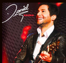
PRA SEMPRE TE AMAR ANO 2010