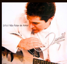
PRA SEMPRE TE AMAR METADE COM METADE ANO 2008