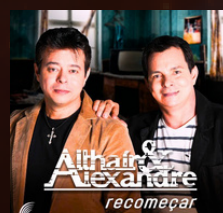
COME QUIETINHO RENDA-SE NÓIS NAMORA ANO 2006