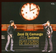
O POVO FALA ANO 2008