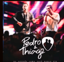
JOGO DO AMOR ROSA FERIDA EU DUVIDO ANO 2010