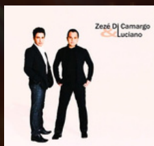
NOIS NAMORA ANO 2007