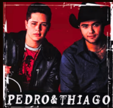
JOGO DO AMOR VÍCIO DOMINADOR SHOW BRASILEIRO AMOR AMIGO ANO 2008